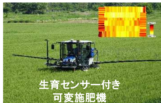
生育センサー付き 可変施肥機