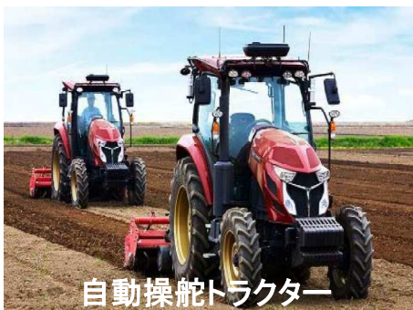
自動操舵トラクター