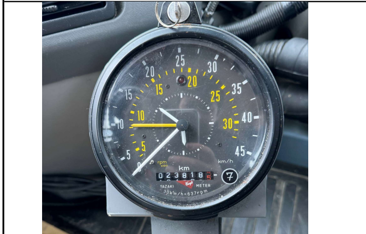
メーター(走行距離)