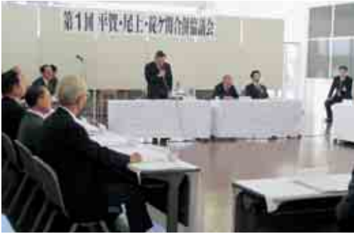
第1回合併協議会開催