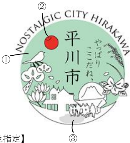
ロゴマーク2 モノクロ