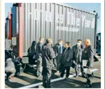
コンテナを利用した宿泊施設

香取市では、歴史的町並みを活用したまちづくりについて研修し、地域資源を活用したまちづくりによる観光誘客について意見交換しました。