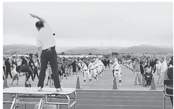
平川市陸上競技場

技場をメイン会場に開催することができないか。 答 多額な費用が必要なことや、人員の確保など課題が多く、マラソン大会の開催は難しいと考えています。今後は、名称やマラソン大会にこだわらず平川市陸上競技場をメイン会場としたスポーツイベントの可否について、検討を進めたいと思います。