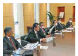
子どもに興味を抱かせる展示、運営について