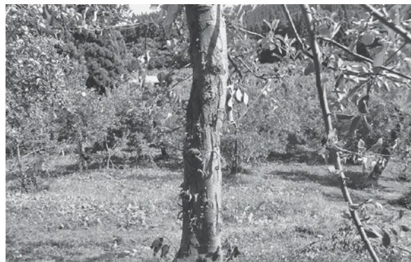
果実だけでなく樹木にも被害を与えています。

止対策については、現在、鳥を追い払うための対策用品を農家個人が購入し、以前からも生産現場では使用されているようであり、現状では、引き続き農業者の皆様の自助努力をお願いするとともに、今後関係機関と連携を密にしながら、効果的な対策の情報収集に努めてまいりたいと考えています。