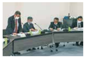
フレイル予防に取り組むまち

防衛省及び内閣官房職員によるミサイル対策勉強会では、自衛隊の果たす役割、避難時の安全確保を研修し、我々のできることについて意見交換しました。