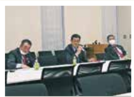
本県上空を通過するミサイル 我々のできる対策とは