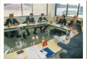
歴史的町並みを活用した まちづくり