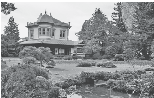
主力観光コンテンツの1つである盛美園

くからあるものを見せる観光に限らず、新しいものを作るなど、様々な視点を入れながら、市全体の観光行政の推進に取り組めます。 議員 市全体を網羅した観光振興であり、継承するのは観光協会であるべきと考える。今後とも、観光行政に対しては、観光協会を軸に、市がてこ入れをしていく形を望む。