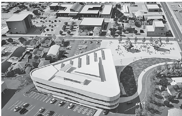
財政運営上、最も有利となるよう事業を進めます。

答 合併振興基金は、新市建設計画に定められた事業に要する経費に充当でき、ねぶた展示館の建設についても充当できるものと考えています。新たに財政運営計画を策定するにあたり、疑義が生じたため、基金の取扱いを県に照会したところ、基金としてそのまま造成しておくということを確認したためです。