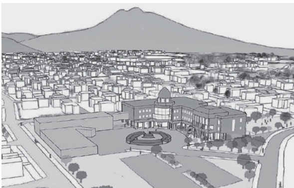
全世代が集えるにぎわいのある施設として設計されます。

らの出土品の展示場所を設け、第3の観光地として、観光客が長く滞在できる複合施設にできないか。 答 平川市郷土資料館に縄文時代から近現代までの民俗資料や歴史資料を常設展示しているため、尾上分庁舎内に常設展示する予定はありませんが、一時的に展示できる場所は検討しております。