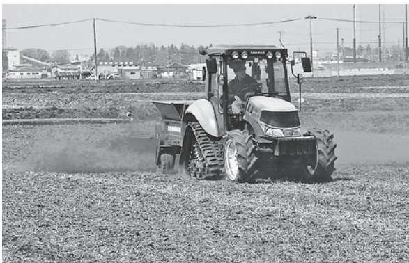
物価高騰により、機械の価格は大きな影響を受けることが予想されます。

助事業を生産組織である防除組合にも行い、個々に配分するよりも生産基盤強化に努めてはどうか。 答 物価高騰の負担軽減に対する事業であり、機械の老朽化による単純更新の支援は行っておりません。今後は、生産組織の再編や担い手確保、機械の共同利用の広域化など、必要に応じた対応をしてみたいです。