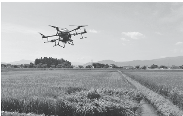
機械化が進む当市基幹産業

ているところですが、今後は、さらに力を入れていく取組として、今年度から、産業振興に係る基本構想の策定に取り組んでいるところであります。当市の基幹産業である農業を中心に、幅広い分野の産業を振興し、しっかり収入を得ることができ、収入を増やしたいと努めてまいります。