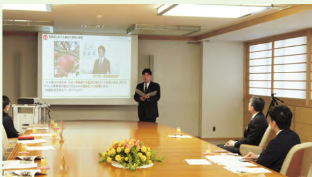
▲県庁での発表の様子

3月21日、県の事業として今年1月に実施された台湾での海外研修の成果を、柏農生たちが知事へ報告しました。りんごのアンケート調査を中心とした内容の発表で、研修で学んだ成果をしっかりと伝えました。