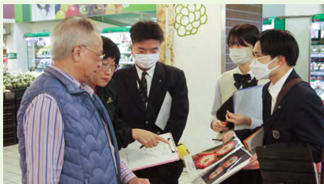
▲台湾研修でのアンケート調査の様子