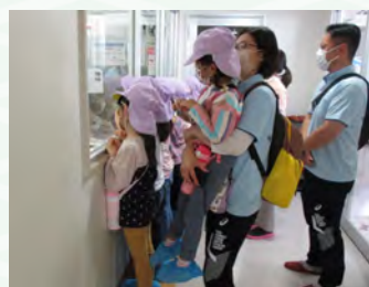
窓から中の様子が見えます

今回は平賀あすなる保育園の園児による見学の様子を紹介します。見学後、青森県学校栄養士協議会のゆるキャラ「あぶにん」がやってきて、一緒に写真を撮りました。