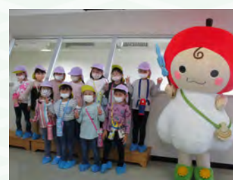
「あぶにん」と一緒に記念写真を撮りました