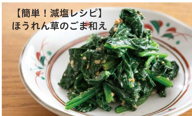
【簡単！減塩レシピ】 ほうれん草のごま和え

❗ 『目指せ！高血圧ゼロのまち「健康ひらかわ」プロジェクト』では、減塩も重要な高血圧対策の一つとして推奨しています。今回は、誰でも簡単においしく減塩できるレシピを紹介します。