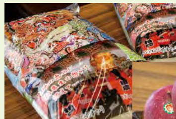
◀▼グローバルGAP を取得した米とりんご