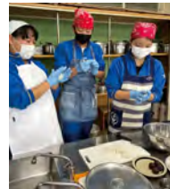
▲上手にあんこを包んでいます。

つぶあん…300g もち米の粉…300g 熱湯…200ml サラダ油…少々 打ち粉…適宜