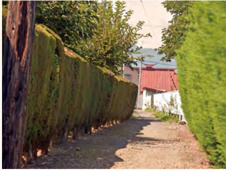
#きちんと整備されたリヤカーけんど