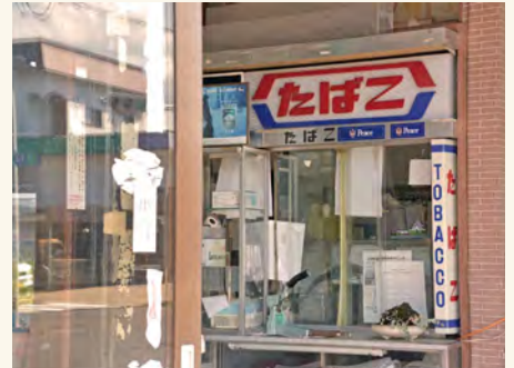
#TOBACCOの対面販売時代が懐かしい