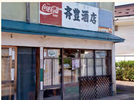
#現在も元気に営業しています