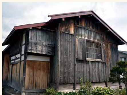
#この建物のなかに蔵があります