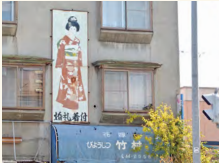
#花嫁専用の美容室だったのでしょか？