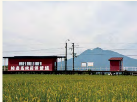
#見慣れた光景ですが改めてみるとノスタルジック