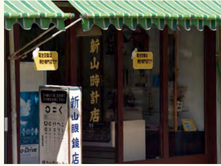
#時計と眼鏡は必需品