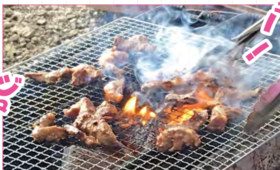
葛西精肉店、水木精肉店のサガリの食べ比べ