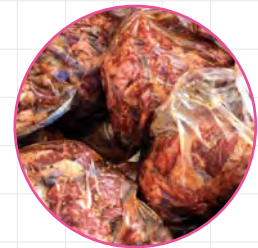
秘伝のタレにつけこまれたサガリ肉

焼肉といえば、一般的な食材として思い浮かぶのはカルビやロースやタンかもしれませんが。津軽地域一円でも屋外で焼肉を楽しむ文化が広まっていますが、そちらの主役は「もつ（豚ホルモン）」です。しかし、平川市での一番人気は「サガリ」。市内の精肉店に行くと「サガリ」をキロ単位で大量に購入している光景を目の当たりにします。「にく」には「サガリ」が付き物で、「サガリ」が無ければ「にく」は始まらないほどです。