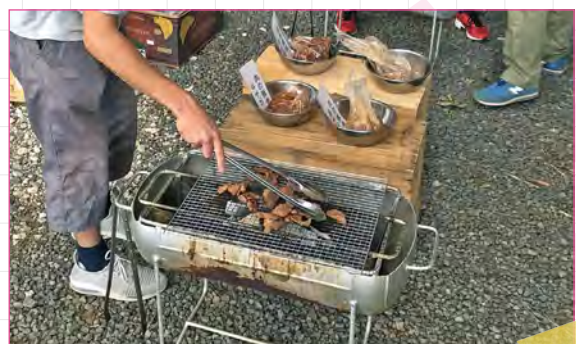
焼き方や焼き加減も研究します