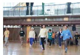
◀写真は介護予防教室の様子