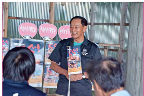
長尾市長から激励のこたば