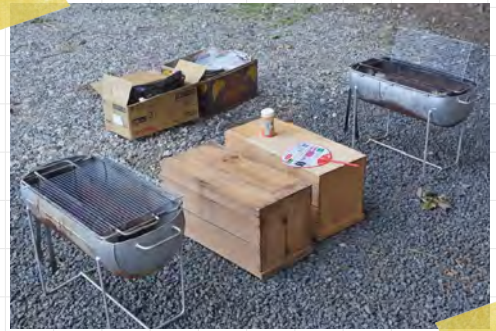
完璧にセッティングされた「にく」会場

「にく（肉）」は一般的な焼肉のこと。焼肉を食べることを「にく、やる」と言います。屋外での「にく」を好むため、シーズンはゴールデンウィークに始まり、8月のねふた祭りやお盆の時期にピークを迎え、夏の終わりまで続きます。「にく、やるが！」の一言で家族や仲間が集まり、あっという間に会場がセッティングされ「にく」がはじまります。そのため各家庭に大人数で囲める大きめのコンロと網が、いつでも運び出せるように用意されています。青森県内で有数のりんご生産地である平川市。りんご農家は畑の作業が一段落すると仲間が集まって「肉（にく）」を食べ、日ごろの労をねぎらう。「にく」は平川市民に親しまれてきたひとつの文化とも言えます。