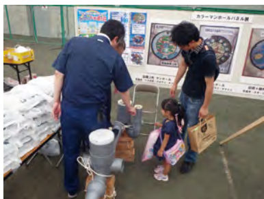
▲ひらかわフェスタで上下水道のPRをしている様子