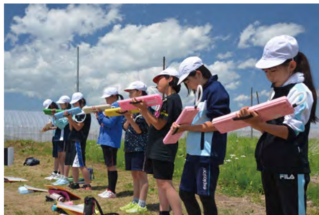
▶猿賀小学校5年生20人が合唱とピアノで「田植え歌」を演奏

5月29日、猿賀神社近くの神饌田 しんせんてん で毎年恒例の御田植祭が行われました。御田植祭は「田植え歌」に合わせて、花笠に白装束姿の田男・早乙女が苗を植える神事で、昭和7年より始まり今年が88回目です。当日は、猿賀小学校5年生が奏でる「田植え歌」に合わせながら、同小5年の児童と氏子ら10人が豊作を願いながら丁寧に田植えを行いました。