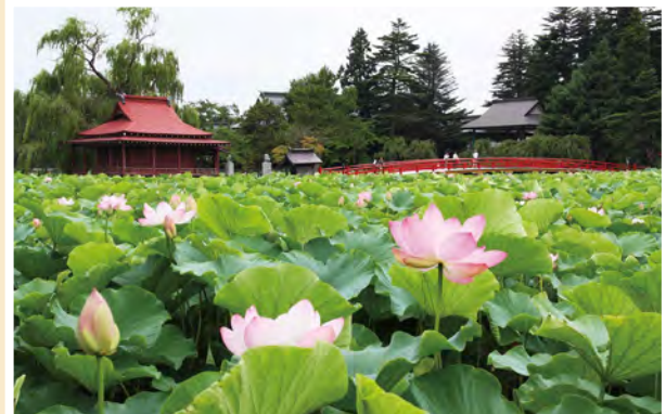
鏡ヶ池に咲き誇る蓮の花

猿賀神社境内にある鏡ヶ池では、7月中旬から8月下旬にかけて、淡いピンク色の蓮の花を楽しむことができます。