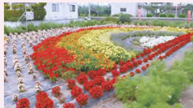
平成30年度最優秀作品