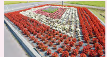
平成29年度最優秀作品