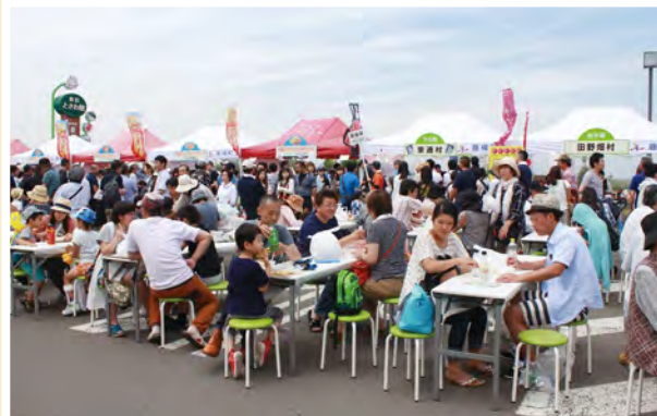
大賑わいの「ふじワングランプリ」

「ふじワングランプリ」とは、町内の店舗・団体が藤崎町の特産品を使ってメニューを考案し、B-1形式でふじさきグルメNo.1を決める食の祭典です！