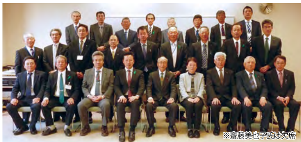
※齋藤美也子氏は欠席

市長が市議会の同意を得て任命する農業委員と農業委員会が委嘱する農地利用最適化推進委員は、農地などの利用の最適化(担い手への農地の集積・集約化、耕作放棄地の発生防止・解消、新規参入の促進)