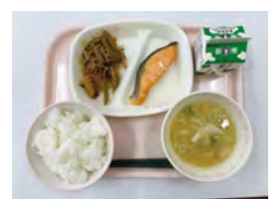
春キャベツのみそ汁 (4月19日のメニューから)

学校給食では味噌汁に大光寺みそを使っています。焼きいりこ(炒った小さいイワシ)でじっくりとだしをとり、季節の野菜などを加えて作った味噌汁に、大光寺みそはとてもよく合います。