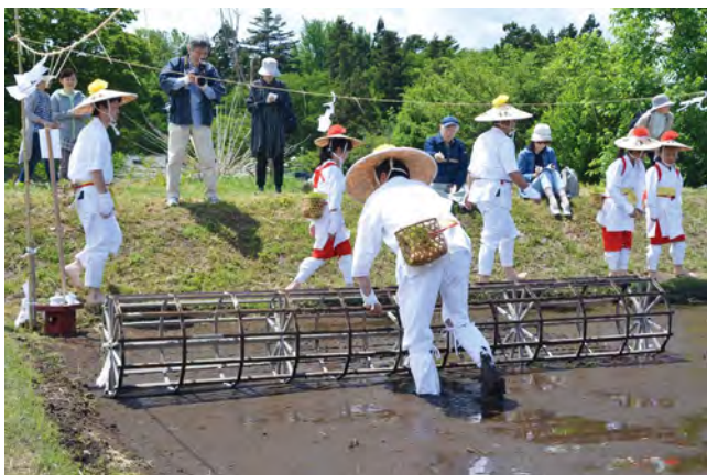
▶「田植え枠」を使用して、植え付ける場所に印付け