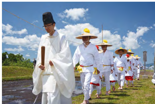
▶神職の先導により神饌田畦畔を一周り