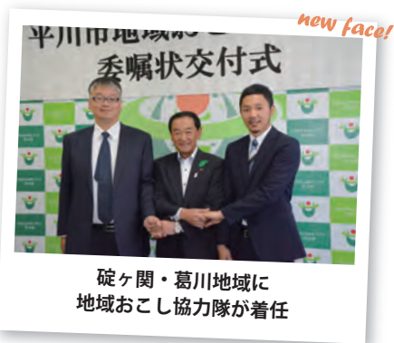
碓ヶ関・葛川地域に 地域おこし協力隊が着任