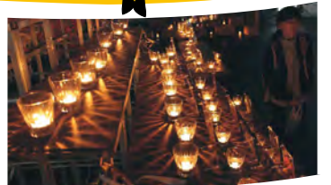
イルミネーションとキャンドルナイトの様子