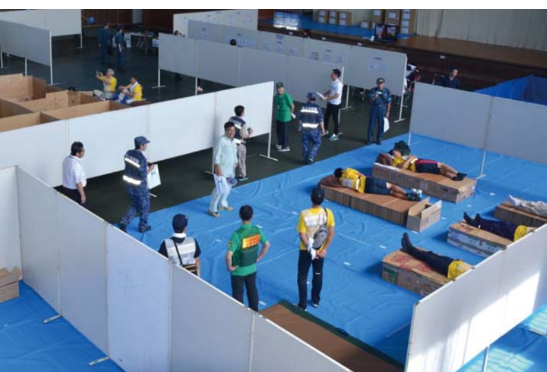
11_災害ボランティア・避難所運営訓練 ボランティアの受け入れや、体育館に段ボールで居住スペースやベッドを作ったり、支援物資を運び込みました。