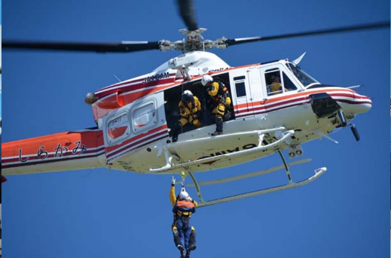
02_要救助者救出訓練 県、海上保安庁のヘリコプターが出動しました。