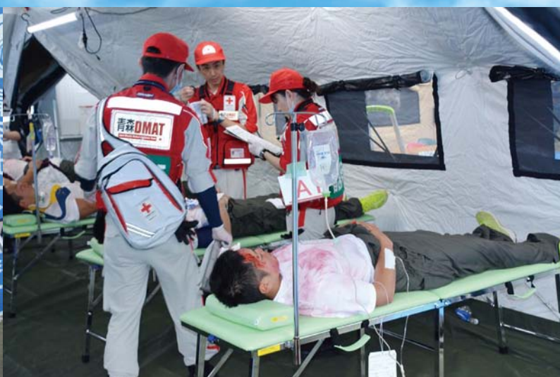
08_SCU設置・運営訓練 傷病者を航空機で搬送するための拠点施設を設置・運営しました。県総合防災訓練では初めての試みです。