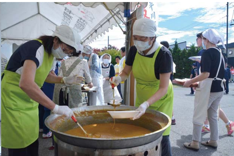
10_炊き出し訓練 市内各地域の赤十字奉仕団らがカレーの炊き出しを行いました。