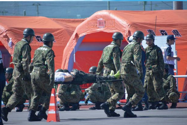
05_現場救護所設置・運営訓練 傷病者の緊急度に応じて適切な応急措置など実施しました。

※毎年9月1日は「防災の日」です。この日を含む1週間は「防災週間」と定められています。