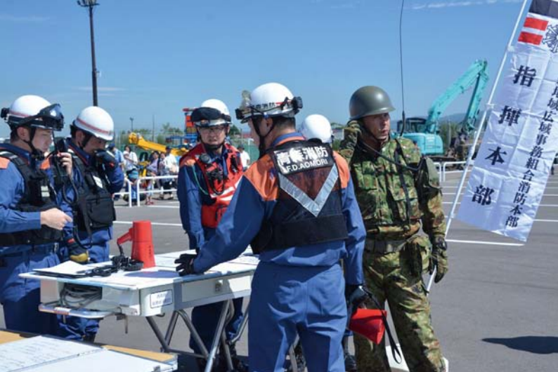
03_現地調整所設置・運営訓練 各機関の責任者などが集まり、入手した情報をもとに各種調整を行いました。