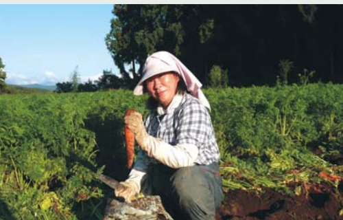
掘りたての人参を手に持つ生産者の女性

自分のお子も給食を食べて育ちました。友達と学校で楽しく給食を食べている様子を聞いて、「給食っていいものだなあ」と思いました。おいしい野菜を友達とみんなで食べてください。