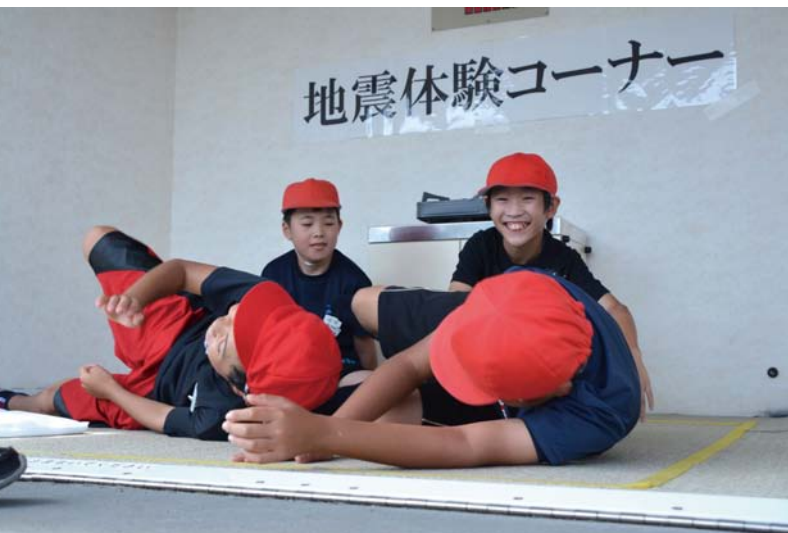
09_起震車による地震体験 小学生らが揺れの強い地震の疑似体験をしました。