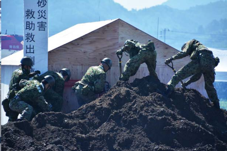
04_土砂災害救助救出訓練 陸上自衛隊が埋没家屋からの救助活動を行いました。

9月4日、ひらかドーム周辺で県総合防災訓練が行われ、自衛隊や消防など県内全域から90機関・団体、約3,500人が参加しました。行政、防災関係機関、地域住民らが一丸となり、被災者の救助や避難所の設置・運営など、災害発生時に迅速・適切に行動できるよう防災の知識・連携を高めました。