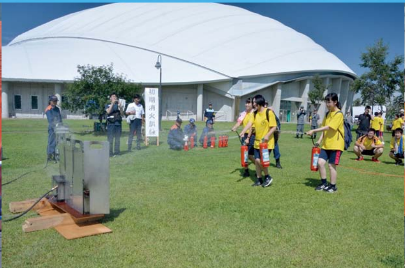
06_初期消火訓練 高校生らが消火体験をすることで、消火器の使い方などを学びました。