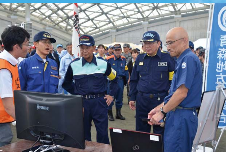
07_緊急地震速報パネル展示 青森地方気象台職員よりパネルについて説明を受けました。