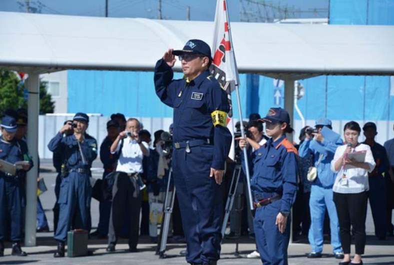
01_訓練開始申告 統監（青森県知事）による答礼。