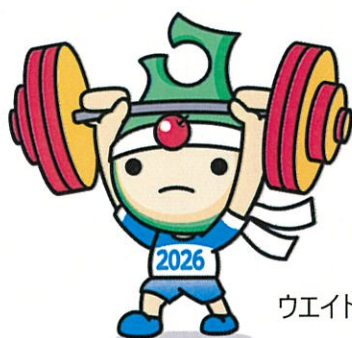
ウエイトリフティング