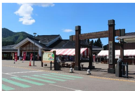
道の駅いかりがせき