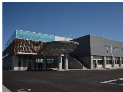
ひらかわドリームアリーナ