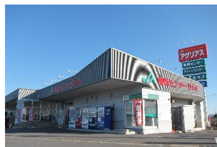
産直センターひらか

北東北にありながら比較的穏やかな気候で、恵まれた美しい自然の四季を体感することができます。