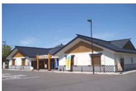
四季の蔵 もてなしロマン館