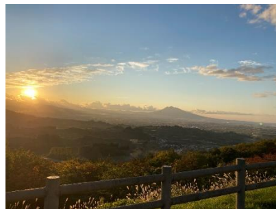
志賀坊森林公園（眺望）