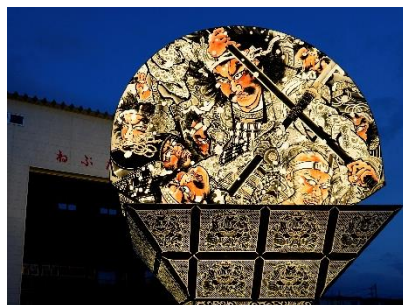
世界一の扇ねぶた