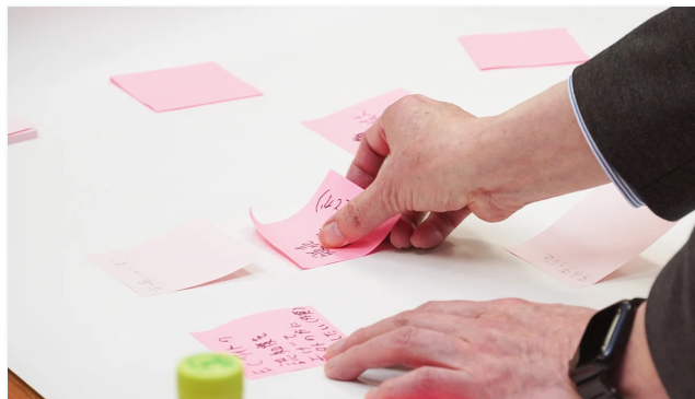
次回の様子をチラ見せ...

平川市の未来を作る「新しい種」は、ここからどう育っていくのか。 どうぞ楽しみに！