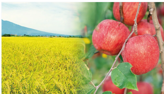
課題が見えてきたら 分析して解決法を模索します

「やってみたいけど、一人では販路の広げ方がわからない」という、切実なハードルも見えてきました。