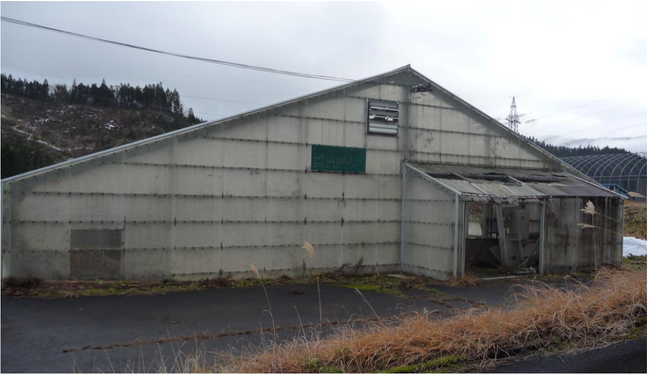
売却物件写真 育苗ハウスB