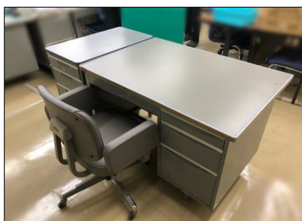
事務机・事務イス