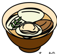
はまぐりのお吸い物

になったのは江戸時代のこと、もと にんぎょう みか じゃま は人形を身代わりにして邪気をはらう なが きげん ぎょうじ 「流しびな」が起源とされます。行事 しく 食として、ちらしずし、はまぐりのお す もの 吸い物、ひしもち、ひなあられなど、 はな た もの なら 華やかな食べ物と並びます。