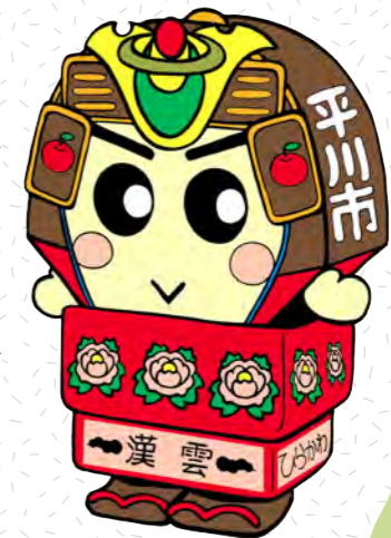
平川市観光キャラクター 「ヤーヤくん」