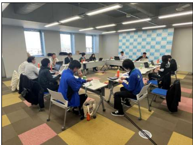
各部会に分かれての説明会