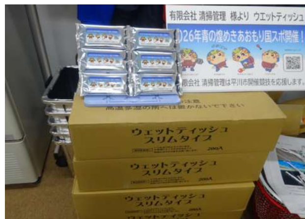
有限会社 清掃管理 (ウェットティッシュ1,000個)