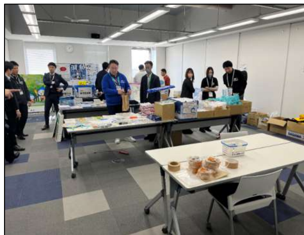
記念品や各種資料を用意