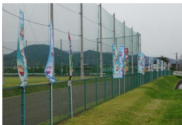
応援のぼり旗を掲示