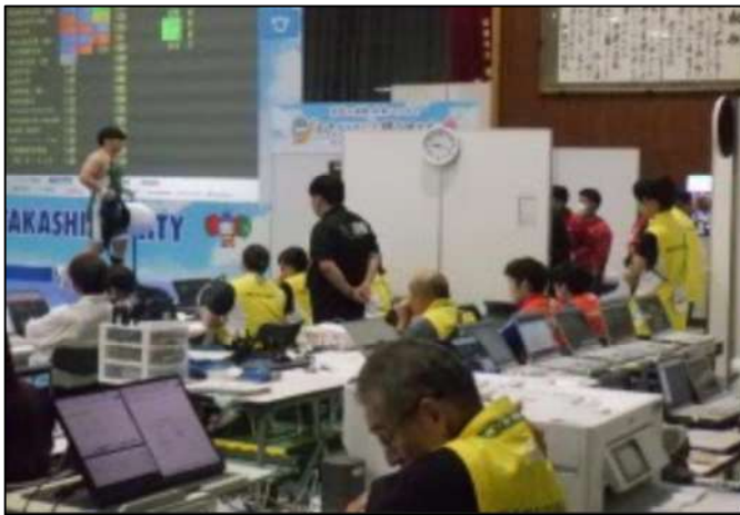
競技会場での記録係員の様子