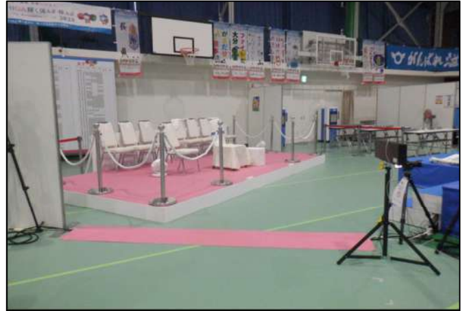
皇族用特別席設置