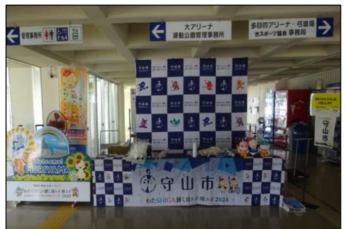
バックボード及び記念品掲示