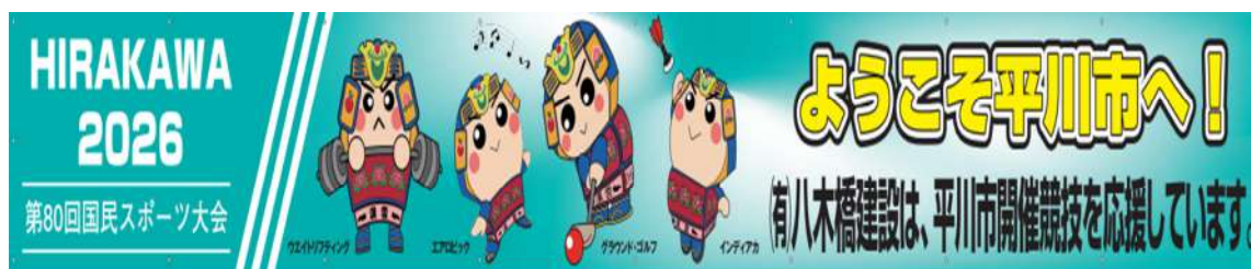
有限会社 八木橋建設 (応援用 横断幕 1枚)