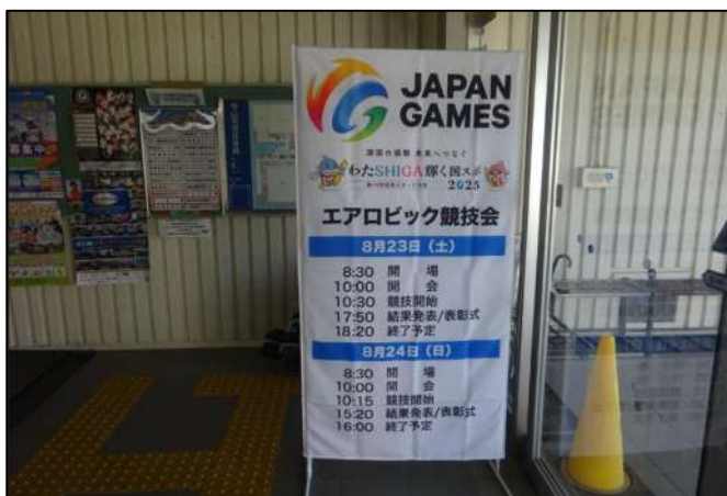
会場入口に看板設置