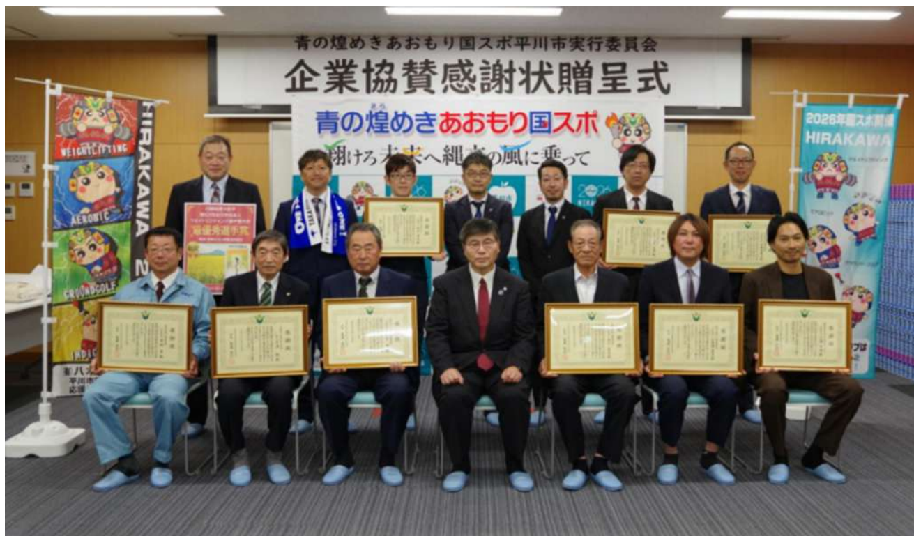
出席者全員で記念撮影