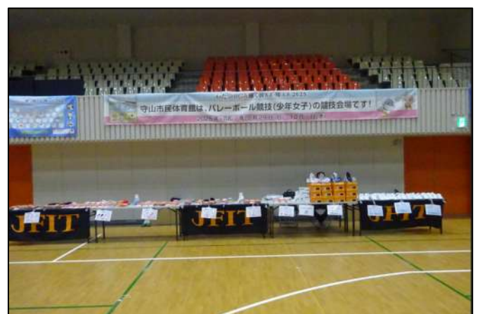
競技会の横断幕掲示