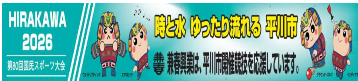
株式会社 兼春興業 (応援用 横断幕 1枚)