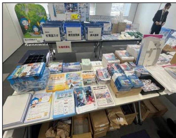
本大会で活用した物品等展示