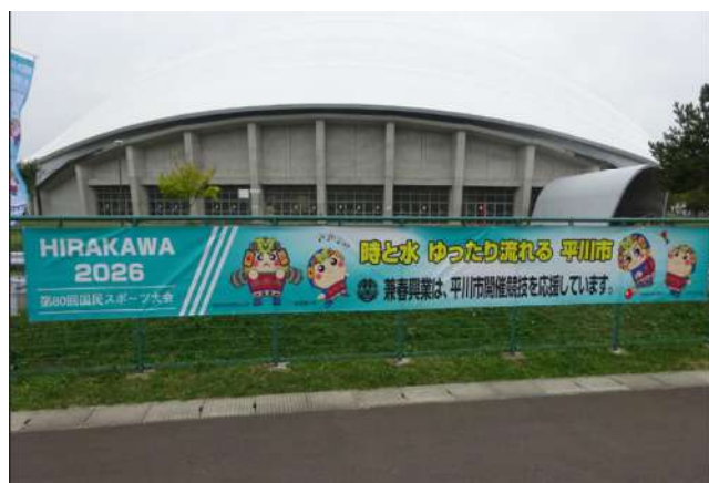
応援横断幕を掲示