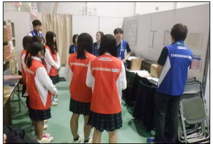
高校生ボランティアが係員で従事