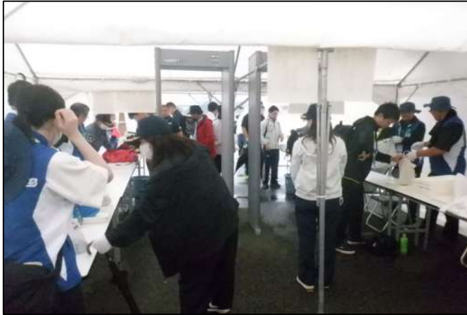
お成り対策として手荷物検査実施