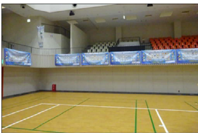
場内に各チームの応援幕掲示