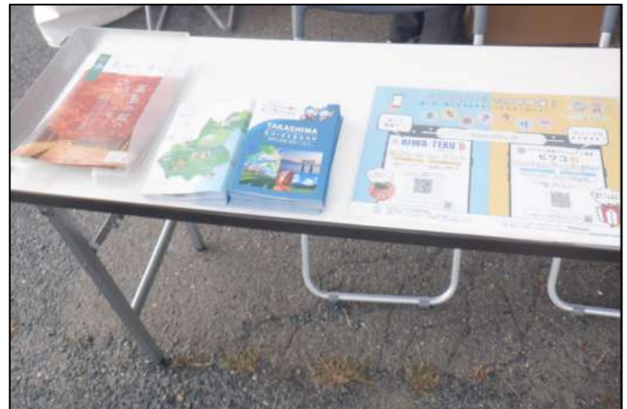
観光パンフレット等を配布