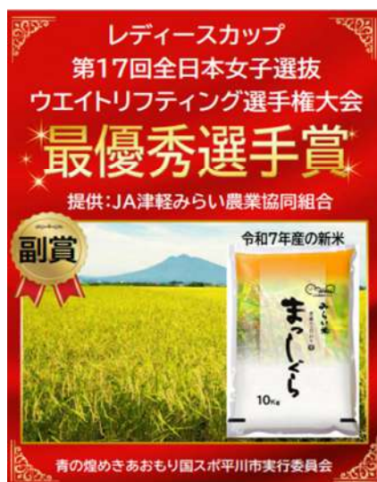
津軽みらい農業協同組合 (みらい米150kg)