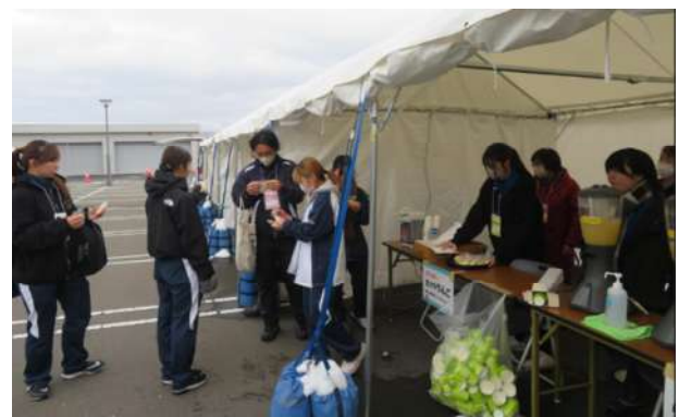
○ふるまいの様子（りんごジュース・カットりんごをふるまい好評）