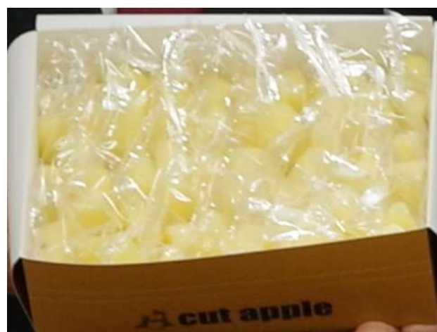
株式会社 アップルファクトリー (カットりんご2,000個)