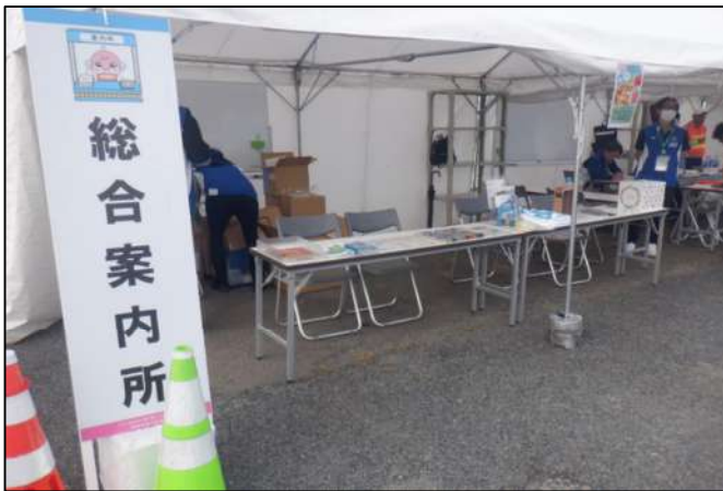
総合案内所を設置して来場者対応