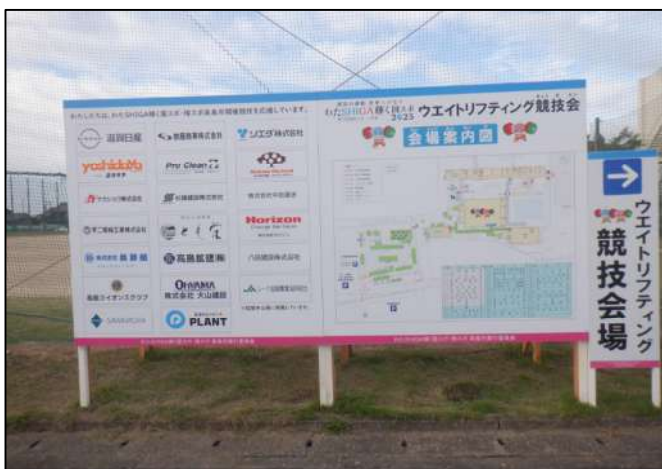
企業協賛協力社名一覧の看板設置