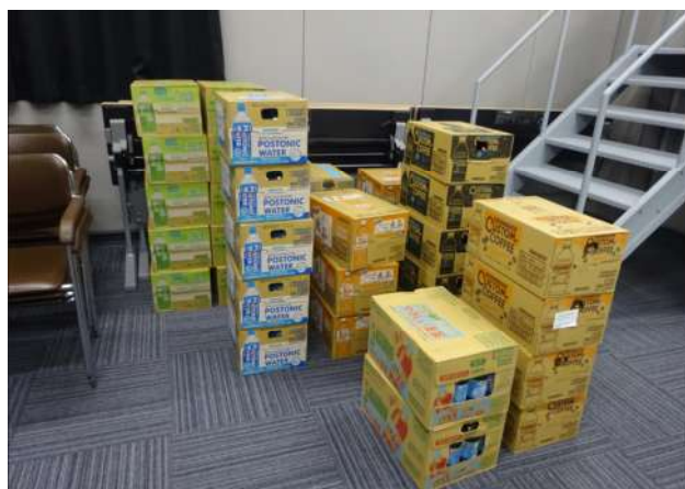
有限会社 田本商店 (ドリンク840本)