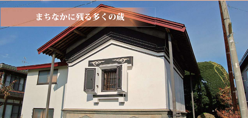
まちなかに残る多くの蔵