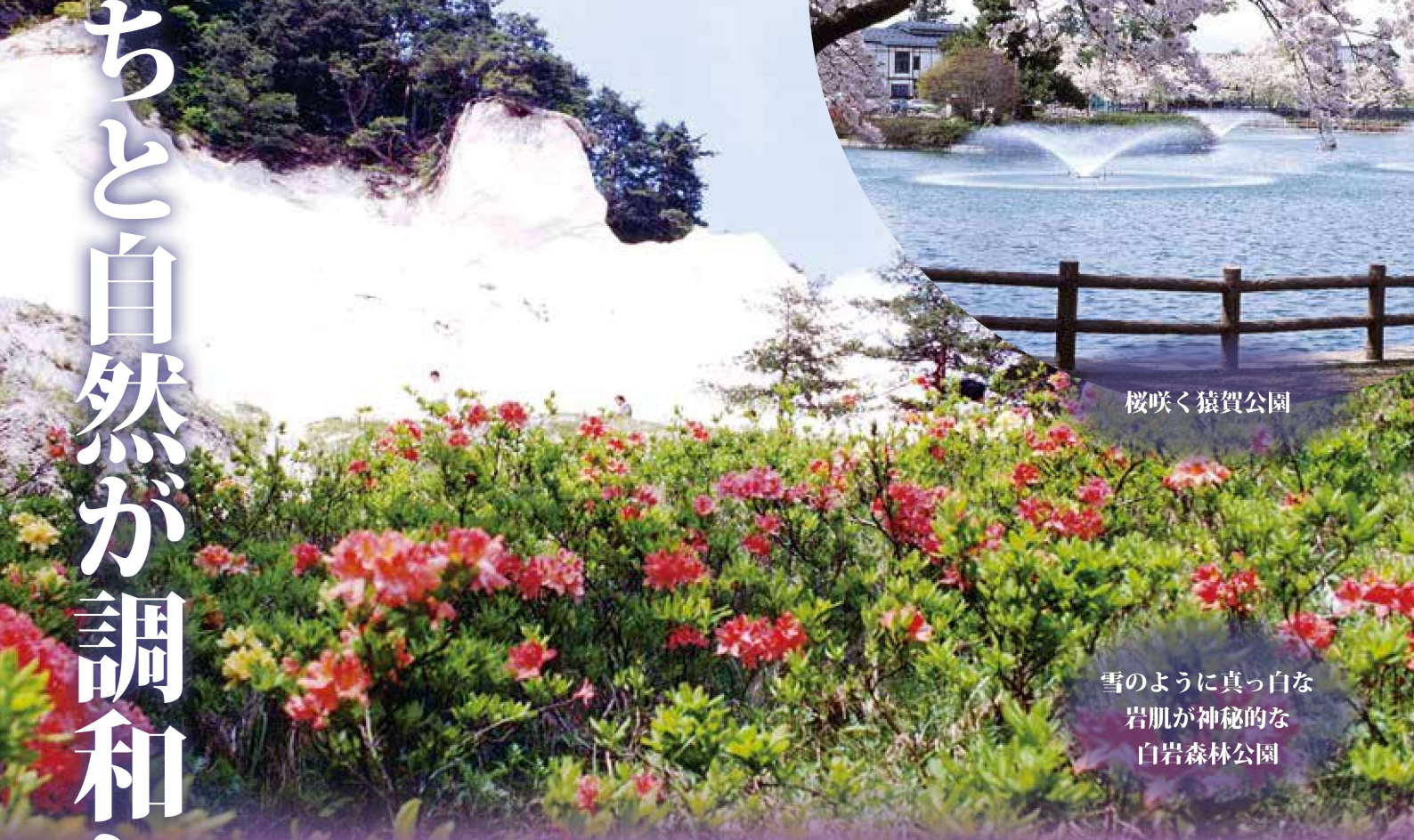
雪のように真っ白な 岩肌が神秘的な 白岩森林公園