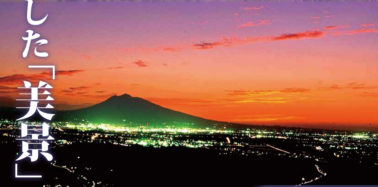
志賀坊森林公園からみた夜景