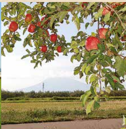
りんご畑と岩木山