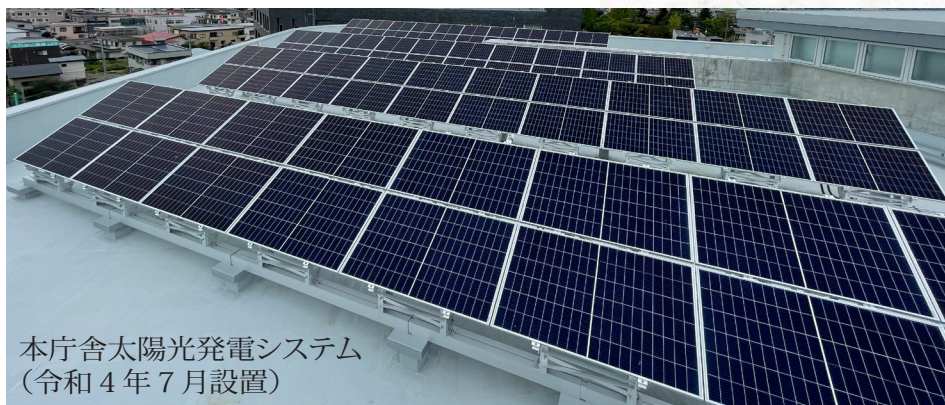
本庁舎太陽光発電システム (令和 4 年 7 月設置)

※ZEBReadyとは、省エネルギー手法の採用によって、建物で消費するエネルギー量を、建築物省エネ法で定める基準値に対し、50%以上の削減を実現した建物。