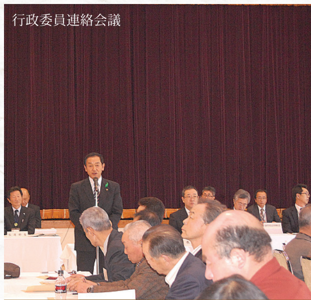
行政委員連絡会議