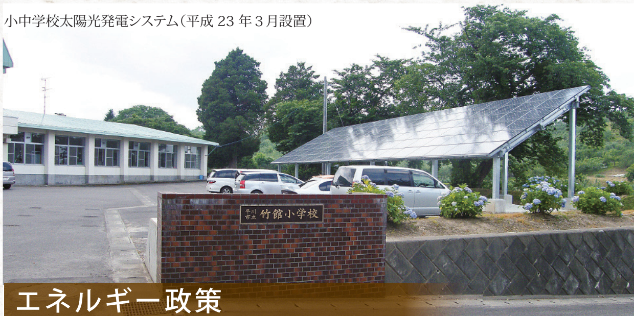
小中学校太陽光発電システム(平成 23 年 3 月設置)

恵まれた地域資源を未来へ引き継ぐために、地球にやさしいまちづくりの推進を図ると共に、公園や緑地、住環境の充実に努めています。