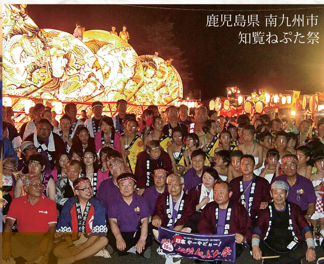
鹿児島県 南九州市 知覧ねぶた祭