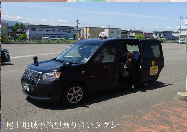
尾上地域予約型乗り合いタクシー