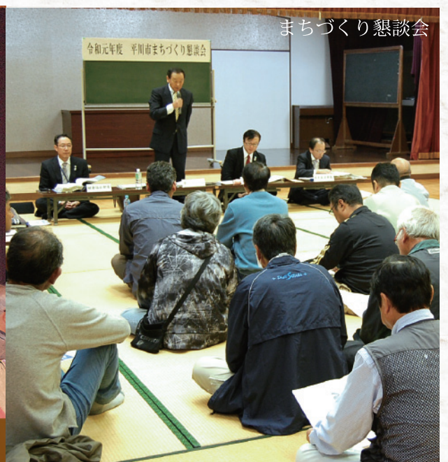
まちづくり懇談会