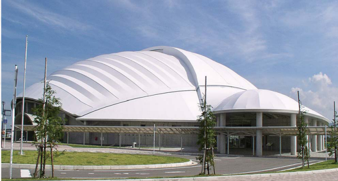
ひらかわドリームアリーナ