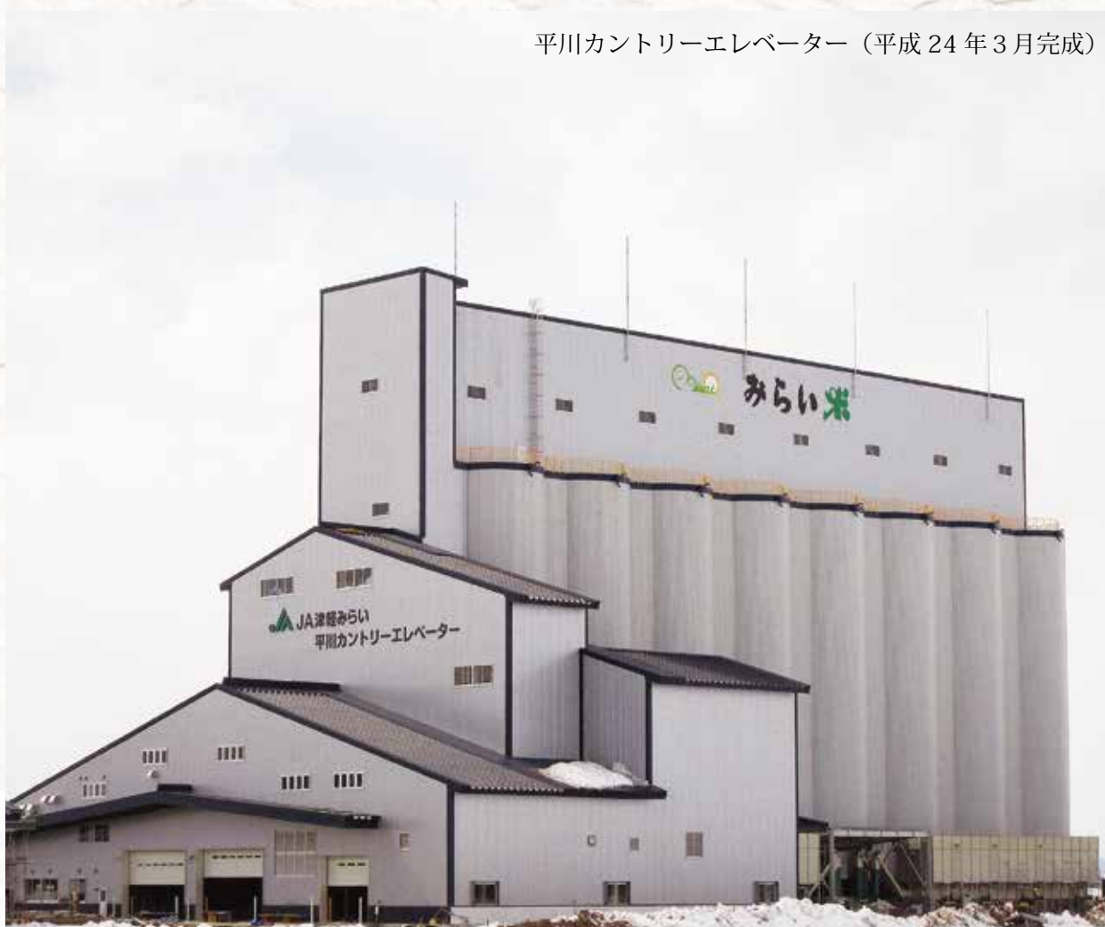
平川カントリーエレベーター（平成24年3月完成）

農業は、当市の基幹産業であり、主要作物としては米とりんごです。また、野菜、花卉、畜産も全国的に評価されています。食の安全・安心を求める消費者ニーズに対応するため、有機栽培や減農薬など積極的に取り組んでいます。