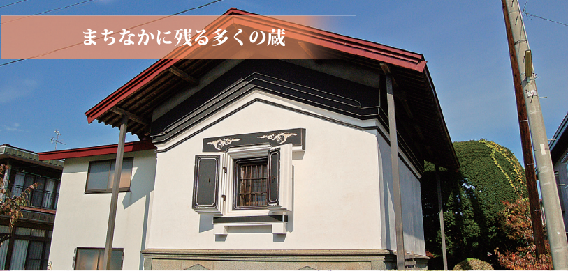
まちなかに残る多くの蔵