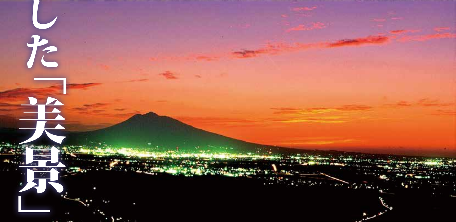
志賀坊森林公園からみた夜景