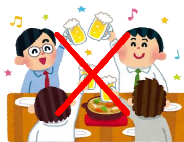
普段一緒にいない人との会食 大勢でのバーベキューなど