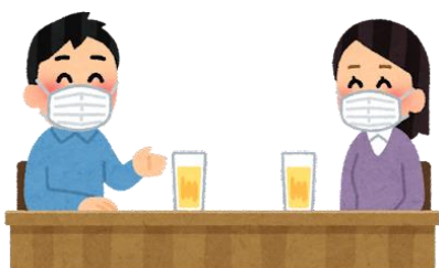
普段一緒・少人数・短時間