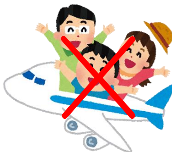
感染拡大地域との往来