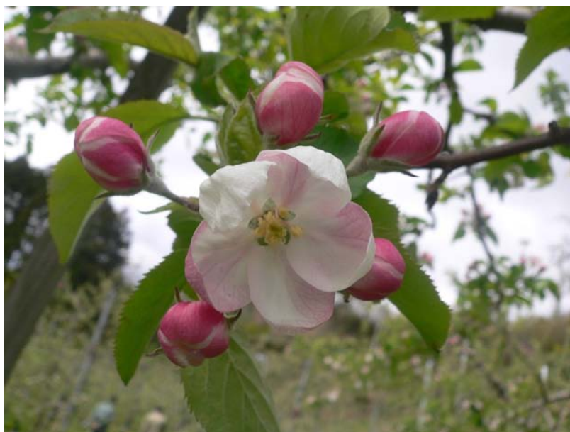
平川市の花：りんごの花