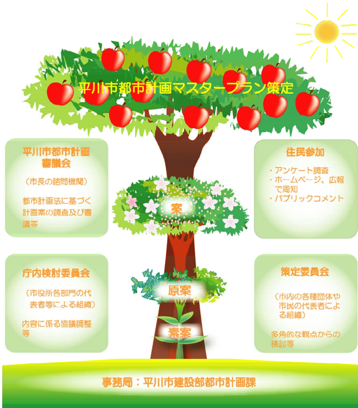
図 序-3 平川市都市計画マスタープランの策定体制

また、庁内の調整組織として「平川市都市計画マスタープラン庁内検討委員会」を設置するとともに、各種団体や様々な分野で活躍する市民の代表者からなる「平川市都市計画マスタープラン策定委員会」を設置し、都市計画マスタープランを多角的な観点から検討してきました。