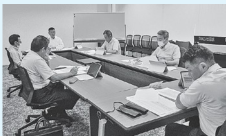
委員会の様子 (令和6年8月5日)

7月2日の議会改革特別委員会では、委員会で審査、検討する内容の優先順位が決められ、平川市議会議員政治倫理条例制定の検討が進められています。政治倫理を確立し、公正な職務執行で適正な議会運営を目指します。