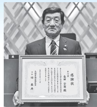
桑田公憲 議員(前議長)