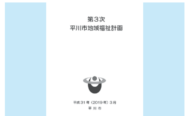
住みよい福祉のまちを創り上げる取り組みの推進を図ってまいります。

いただいています。 議員 第3次平川市福祉計画には、計画が具体化されているとは感じられない。災害の頻繁な発生障がいのある方も地域で安心して暮らすためにもこの力作を市民に向けての周知が必要では。