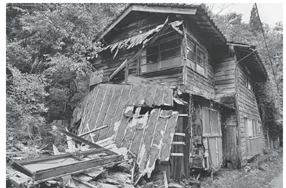
空家は近隣への影響もあり、適正な管理が求められます。

答 建物の除却費用は所有者の責任において解決すべきであり、手続きが法律で定められていることから、法定外目的税の創設は難しいと考えます。 議員 空家の利活用のため、地域住民等が活用する場合、改修費や家賃等に対し助成できないか。 答 町会の集会施設があるため、実施は考えていません。