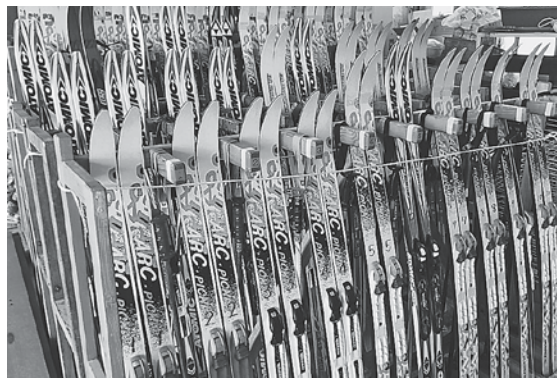
スキー用具の準備は、家計へ大きく影響します。

いません。 議員 教育委員会主導で実施可能か。 答 寄付下さる方や要望する方、学校との調整など、非常に困難と想定されます。 議員 スキー用具購入が1人で3回となる家庭もある。経済的負担軽減だけでなく、物を大切に使う教育のためにも取組を検討してもらいたい。