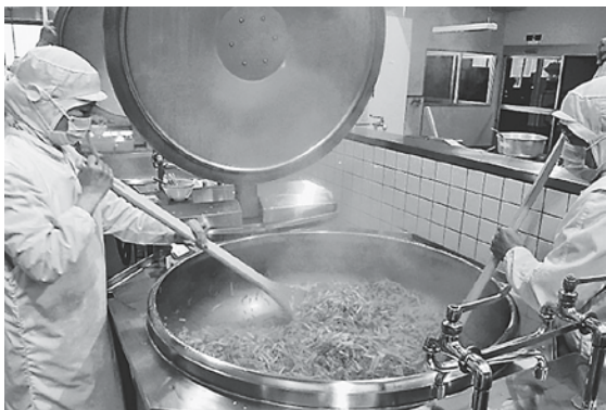
自主財源を活用し、学校給食費無償化事業などいろいろな事業を行っています。

て実施した主な事業と額については。 答 令和2年度と3年度に、公共施設感染症対策事業、市内事業者事業継続事業、学校給食費無償化事業などを実施し、自主財源は合計で2千7百万円でした。4年度は3億7千万円の自主財源を見込んでおり、財源の多くに国交付金を活用して事業を実施しています。