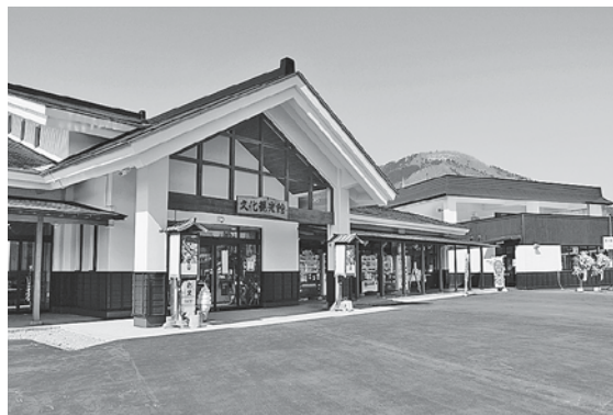
リニューアル後の道の駅いかりがせき

を開催する考えはあるか。 答 地元団体等と相談し検討してまいります。 議員 広域的な防災機能を担う防災道の駅の指定を目指してはどうか。 答 令和3年6月に県が示した洪水浸水想定図において、道の駅いかりがせきは浸水想定範囲に含まれているため、防災道の駅の指定は難しいものと考えます。