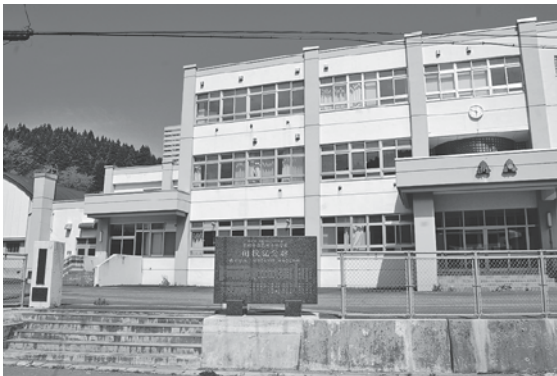
旧葛川小中学校の外観

設と消防屯所が建設される計画だと聞いている。現在、集会施設を借りる際、鍵は葛川支所管理になっていて不便と感じているが、今後どのような使用方法になるのか。 答 現在の計画では、集会施設は指定管理を予定しています。また、鍵の貸出については、スムーズに貸出できるように検討してまいります。