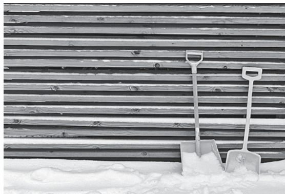
問口の除雪は大変重労働です。