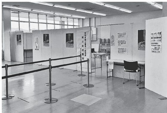
4月9日青森県議会議員一般選挙の期日前投票所

イナポータルを利用し、投票用紙をオンラインで請求できる自治体もあると聞く。市外滞在者の利用が増え、投票率向上につながることから、当市でもオンライン化できないか。 答 投票用紙が手元に届くまでの日数が短縮され、利便性向上につながることから、できる限り早く実施したいと考えます。