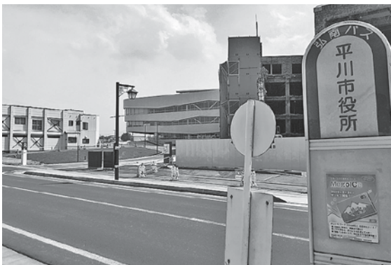
平川市役所前のバス停

入路の設置にはかなりのスペースを要するため考えていません。 議員 ふらっと広場への設置も視野に入れ、バス進入路や待合室の設置場所を再考すべきでは。 答 現在は、移設後の中央公園南口付近も候補に検討しており、バス利用者の利便性の高い場所に設置できるよう、担当課で検討します。