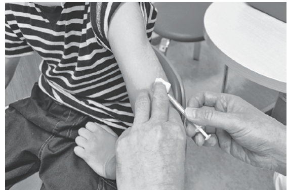
5類移行後においても、引き続き情報提供してまいります。

議員 PCR検査センターは3月31日で終了とのことだが、今後の検査はどのように行うのか。 答 市販の検査キットを購入するか、青森県臨時Webキット検査センターから検査キットを取り寄せるなどして検査していたたく形になります。 議員 コロナ対応状況は日々変化している。迅速な情報提供をお願いする。