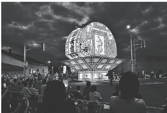
祭り期間以外でも安全・安心な防犯対策が求められます。

議員 駅前通りの防犯カメラ設置台数は。 答 黒石地区防犯協会で設置しているカメラは8基となっています。 議員 大きな催し物では人口以上の来客者が訪れる。問題事が起きた場合、イメージダウンにつながるかねないことから、安全・安心のために臨時のカメラを設置するなど、対策をお願いしたい。