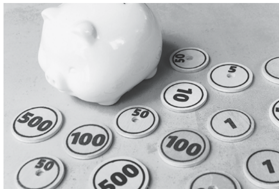
原油価格・物価高騰は、一般家庭の家計へ打撃を与えています。

とタイアップした事業を市で可能かどうか検討してまいります。現在、市では事業者の資金繰りへの支援として、青森県経営安定化サポート資金を活用し融資を受けた事業者に対し、信用保証料の全額を補助しております。今後も、商工会や金融機関と情報交換しながら、必要な対策を検討してまいります。