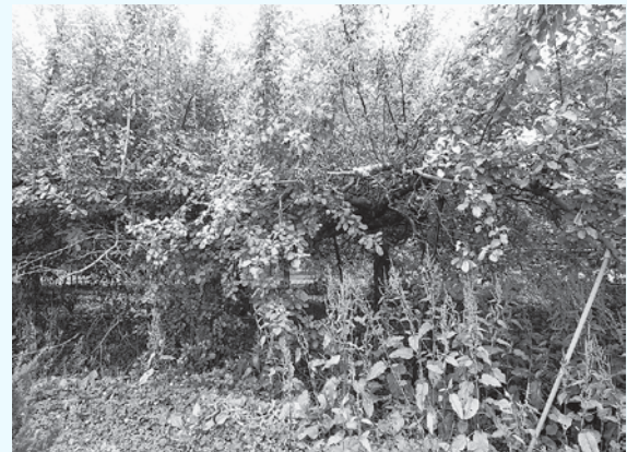
栽培管理がされなくなった放任園

②放任園対策をしていただけない方を一緒に説得したり、事例ごとに相談に乗ってもらったりしながら対応している。