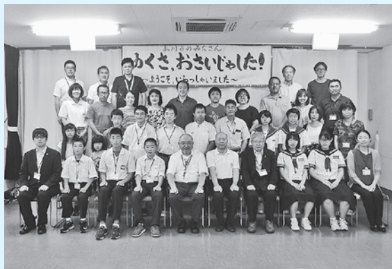
南九州市との交流事業

中・高校生を気候風土の異なる地域に派遣し、その地域の風土・文化・産業を学ぶことにより青少年活動の活性化を図るもの。平成30年度は7月21日から3泊4日、生徒7名と引率者3名を鹿児島県南九州市に派遣した。