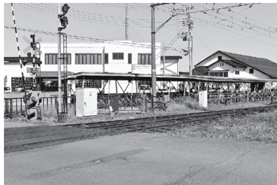
津軽尾上駅から出て踏切を越えたところにある駐輪場。電灯がありません。

ると思います。 議員 駐輪場以外の場所に駐輪する自転車が多い。放置自転車もある。電灯もなく、夜は鍵を落としても探せない暗さである。 答 現地調査の結果電灯がないことを確認しています。指定場所以外に駐輪されてある自転車については以前関係機関に働きかけています。明かりの対応についても伝えます。