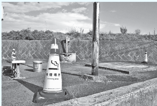
本庁舎裏の喫煙場所

本庁舎、尾上・碓ヶ関各庁舎、文化セン ター、ひらかドーム、平賀体育館、B&G 尾上体育館、新体育館の8カ所分の予算を 確保し設置することで進めている。