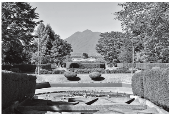
撮影スポットがたくさんある猿賀公園。

答 今後、ふるさとセンターの改修とともにトイレが撤去されます。代替施設については、敷地全体のバランスを見た上で今後検討します。 議員 鏡ヶ池のレンコンは体にもよくおいしい。猿賀の神様の贈り物と思っている。池にはアメリカザリガニもいる。資源を活用した観光振興を考えてもらいたい。