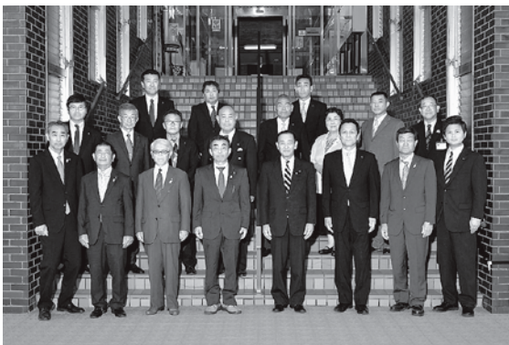
令和元年7月7日執行平川市議会議員一般選挙の投票者は1万6,936人、投票率は63.41%。

を失う恐れがあることに加え、市民サービスの低下につながりかねません。そのため投票所の閉鎖時刻は、現状のままとさせていただきます。 議員 公職選挙法の縛りがあるというが、他市の実施例を参考に情報を仕入れ検討してほしい。午後6時までにとすると投票者もその時間で動くはず。