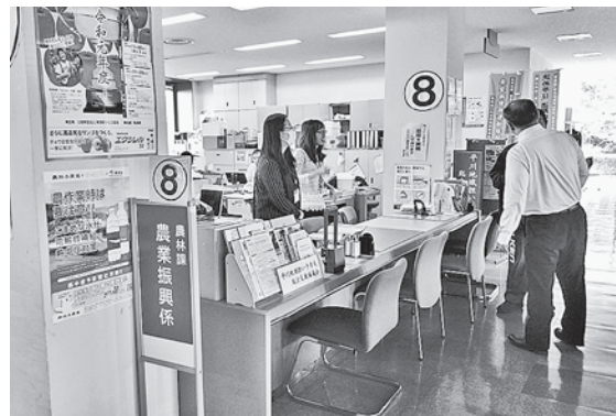
農家経営については、尾上総合庁舎にある農林課へお気軽にお問合せください。

には活用しにくい。 答 農家レストラン等への支援は、例えば市内の空き店舗を活用して事業を行い各要件を満たす場合、平川市空き店舗対策事業補助金の活用が可能と見込まれます。 議員 空き店舗活用以外の取り組みは。 答 現在ありませんが、相談があればどういった支援が可能か検討します。