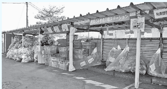
本庁舎の資源ごみ回収ステーション