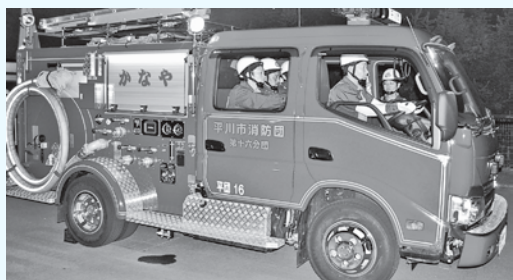
地域における消防・防災のリーダー