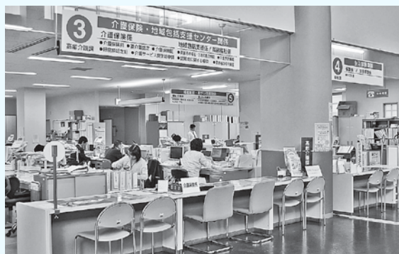
平川市地域包括支援センターは、健康センター3番窓口にあります。

②市内の在宅介護支援センター5カ所に委託している。地域包括支援センターに情報をつなぐ窓口機能を持つ協力機関であり、担当区域の高齢者に関する総合相談の初期対応、訪問による高齢者の生活状況調査などを行っている。