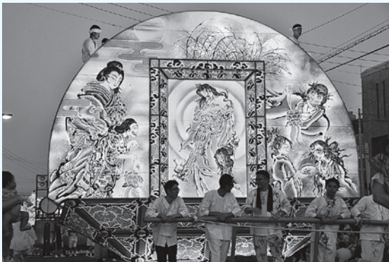
平川ねぶたまつり2019

報償費は、各合同運行に参加した団体への運行奨励金。ねぶたまつり補助金は、平川ねぶたまつり実行委員会への補助金。