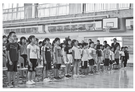
元気に統合創立30周年記念ソング「FRIENDS!」を斉唱中の猿賀小学校の皆さん。