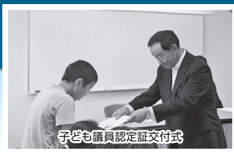
子ども議員認定証交付式

この日は議会の仕組みを学び、テーマ別に分かれた各班で、質問を考え説明ボードを作成しました。