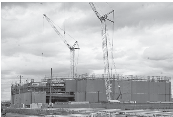
12月完成を目指し建設中の新体育館。

なります。 議員 本来基金は借金の穴埋めではなく市民の暮らしに回すべきもの。人口は減っていく。見通しが甘い。 答 計画では危険水準に達しない見通しです。心配には及びません。 議員 不測の事態が発生したときに市民の暮らしを守る構えが必要。私は心配している。