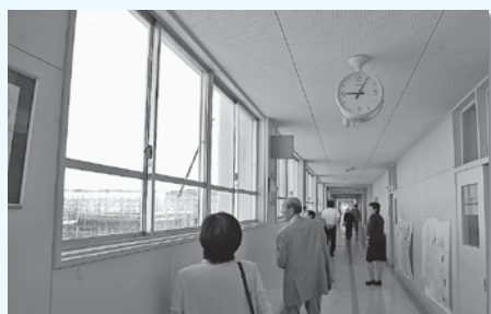
窓越しに新校舎建設の進捗状況を確認しました。