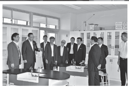
見学会では市教育委員会より説明を受けました。

かねてより建設していた猿賀小学校校舎が完成し、8月26日から新校舎において授業を行っています。同日、当市議会議員も来賓として招かれ開催されたオープニングセレモニーでは、児童の呼びかけと統合創立30周年記念ソング「FRIENDS!」の斉唱などが行われました。その後に行われた完成見学会では、真新しい新校舎と児童や卒業生らが旧校舎に描いた「思い出づくりプロジェクト」によるイラストやメッセージなどを見学しました。