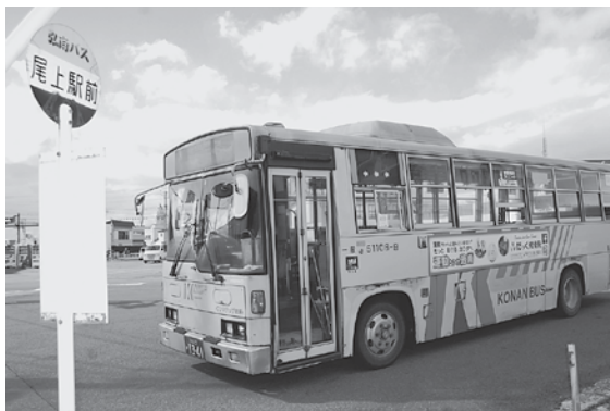
平成30年11月30日で廃止や減便になった尾上地域の路線バス。

意見を伺う乗り込み調査を実施します。また、平川市地域公共交通協議会に、アンケート案やその結果を示し、今後の地域公共交通再編へ向けた協議を進めていきます。 議員 新庁舎完成に合わせ、公共交通システムの見直しをするのでは待てない。もっと早く再構築をお願いしたい。