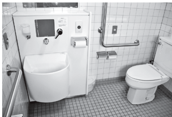
道の駅いかりがせきに設置しているオストメイト対応トイレ。

答 市ホームページには掲載していませんが、県運営インターネットサイト「青森県バリアフリーマップ」に情報提供しています。 議員 県のサイトは更新が遅い。いろいろな媒体で情報発信していただきたい。