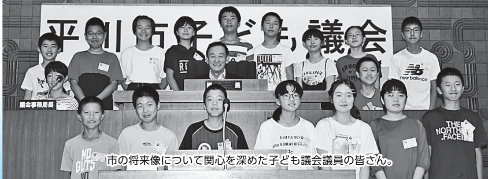
市の将来像について関心を深めた子ども議会議員の皆さん。