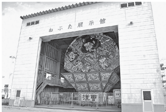
世界一の扇ねぶたは、午前8時30分～午後4時30分にねぶた展示館で見学できます。

議員 一筋縄ではいかないと思うが、様々な機能を兼ね備えた新展示館の建設に向けまい進していただきたい。