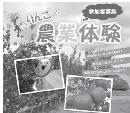
りんご農業体験は、11月30日まで実施しています。

答 利用者が継続してサービスを受けることができるように、市内の在宅介護支援センターや地域包括支援センターで別の事業所を紹介、調整します。 議員 人口減少対策と人材の確保ができないと前進できない。今後大いに奮起してほしい。