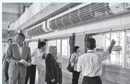
今後も使用される平成15年築の体育館で説明を受けました。