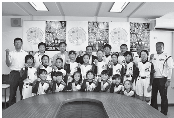
7月に開催されたソフトボールの全国大会に出場した平賀東・竹館SBC

議員 全国大会に出場するクラブチームへの大会派遣費の補助制度を検討してほしい。 答 今年度予算が動いているため、前年度と同様に補助制度の運用をしていきます。内容は来年度に向けて検討していきます。