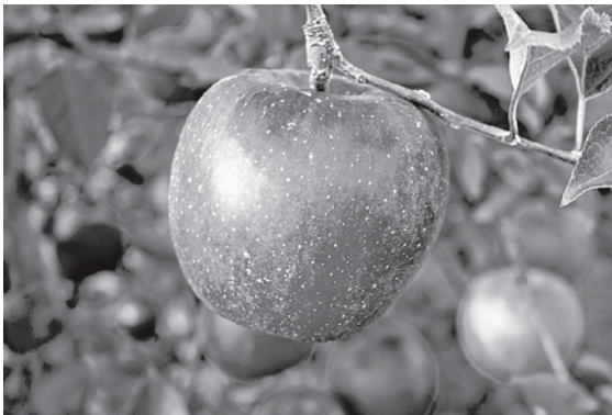
今年もすばらしい出来秋を。

用されており、これは全収穫量の14%を占めていることから、りんご消費拡大の効果は期待できるものと考えます。市としても、特産品であるりんごの消費拡大と地場産業振興の取り組みの一環として、今後関係者から意見を聞きながら制定に向けて検討します。