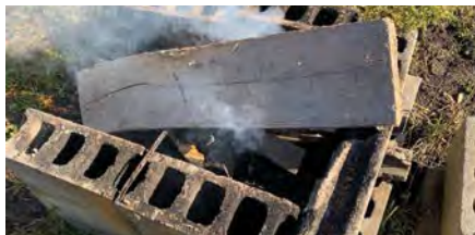
多量の煙が出る焼却