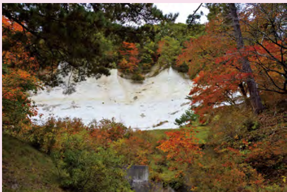
# 白岩森林公園 # 紅葉 # 凝灰岩 # 白い岩