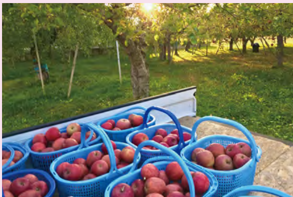
# りんごもぎ # 収穫 # ふじ # 今年も沢山獲れました