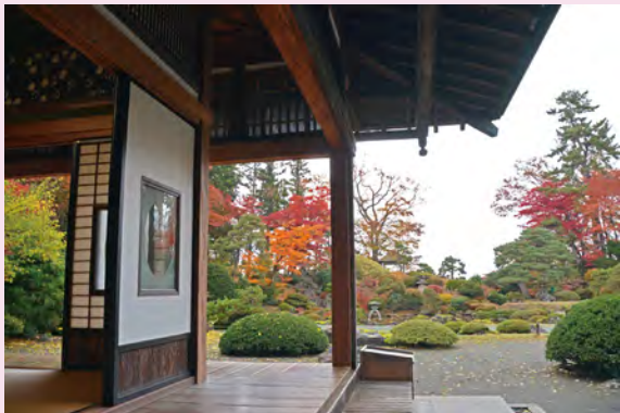
# 盛美園 # 紅葉 # 縁側 # そろそろ冬支度