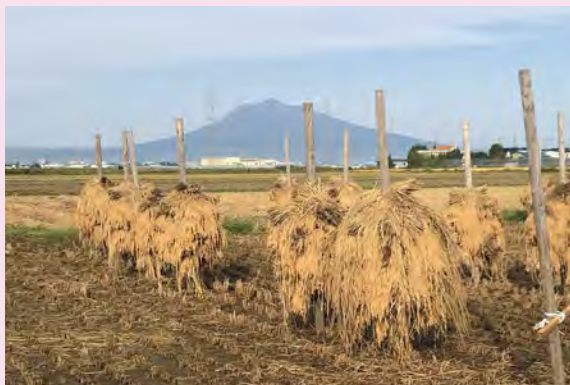
# 棒かけ # 田んぼ # 収穫後 # 今日も岩木山がきれい