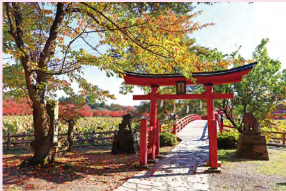
# 猿賀神社 # 紅葉 # 鳥居 # 蓮は来年までお休み