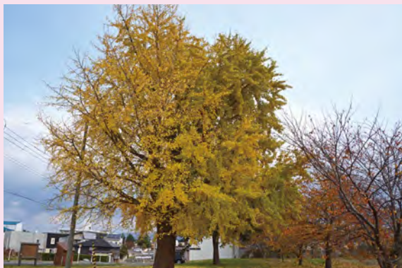
# 大光寺 # いちょう # コミュニティセンター前 # 銀杏