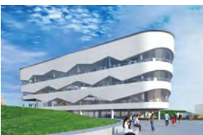
新庁舎の外観イメージ

市から ●新本庁舎のデザインはプロポーザル方式で12の応募があった中から、選定委員が5つのデザインを選び、プレゼンテーション実施後に選ばれている。