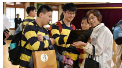
台湾からホームステイに訪れた学生

●近年、外国からの観光客が増えているため、観光施設の表示を何ヶ国語で作ったり、台湾の学生のホームステイ事業を行うなど、国外からも観光客を取り込めるようにしている。しかし、宿泊施設が少なく長期滞在しづらいのが難点であるため、民間や観光協会、物産協会などと連携しながら観光誘客を進めていきたい。