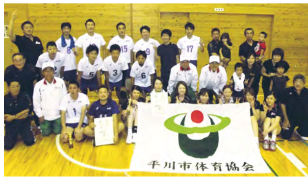
[問合せ] B&G尾上体育館 ☎57-4633

大人子供に関わらず、部員募集を随時しておりますので、興味のある方は、お気軽にお問い合わせください。