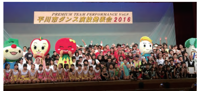
写真は、2016年の「平川市ダンス演技発表会」の様子