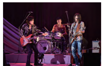
平川市出身ギタリスト 「ichiro」凱旋ライブ