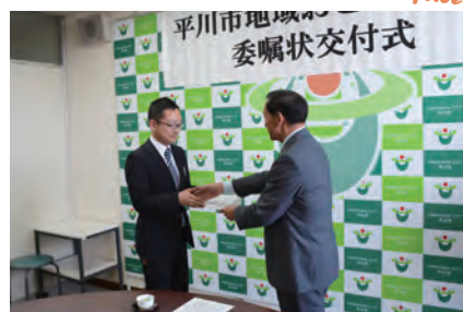
碓ヶ関地域に 地域おこし協力隊が着任