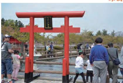
猿賀公園に新スポット 「こいこい神社」を設置