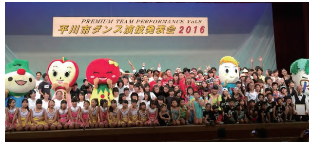
写真は、2016年の「平川市ダンス演技発表会」の様子