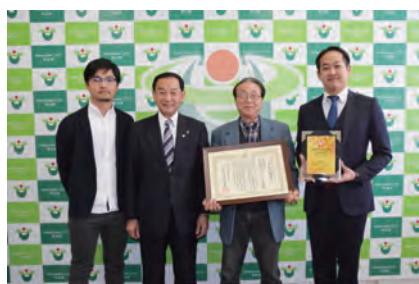
農業生産法人 株式会社グリーンファーム農家蔵 「おもてなしアワード2017」 最高賞の県知事賞受賞

市内全ての保育園・こども園の施設長らが「ホイクボス宣言」をしました。「ホイクボス」とは、「保育」と「イクボス」を組み合わせた造語で、平川市独自のものです。ワークライフバランスに配慮した職場環境づくりに取り組むことを誓いました。