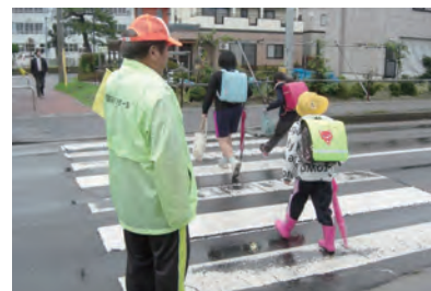
登下校時の見守り活動

あなたのお住まいの地区にも民生委員・児童委員はいますので、お気軽にご相談ください。