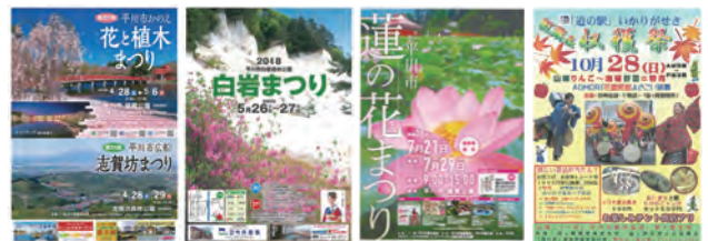
今年も1年ありがとうございました。 来年もよろしくお願いいたします！