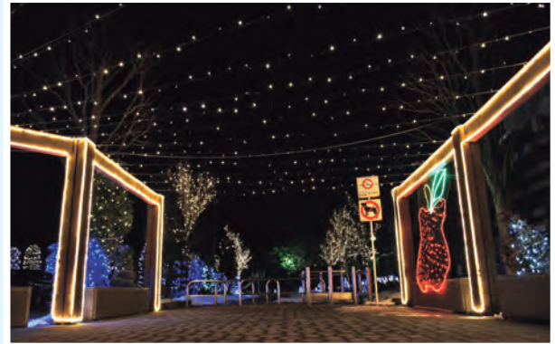
平賀駅前広場を彩るイルミネーション

平賀駅前通りを中心に、約7万個のイルミネーションでライトアップします。さらに、今冬は初の試みとして、7色に光り輝く台湾提灯を駅前広場に飾り、より幻想的な雰囲気を演出します。