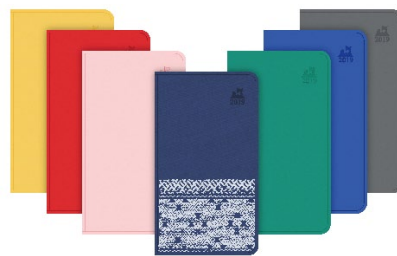
※色はイメージです

【通常版】 430 円 全 6 色 ●まぐろブラック ●さばブルー ●りんごレッド ●けまめグリーン ●だけきみイエロー ●ももピンク