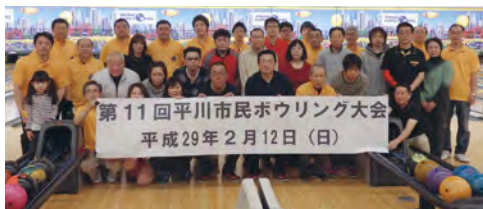
第11回平川市民ボウリング大会 平成29年2月12日(日)