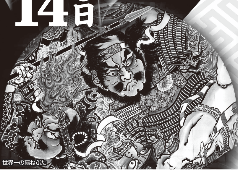
世界一の扇ねぶた