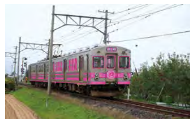
アート列車 車両イメージ 【秋 弘南線（平賀 - 柏木農高前）】